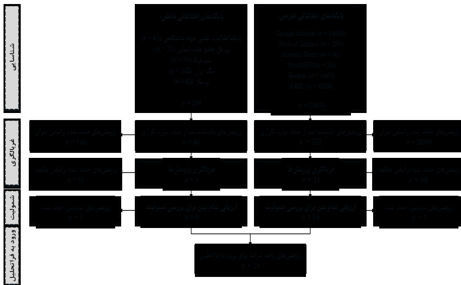
شکل ۱. روندنمای انتخاب پژوهش‌های واجد شرایط ورود به فراتحلیل به کمک رویکرد پریزما

تعدیل‌گر استفاده می‌شود. معیارهای ناهمگنی شامل شاخص کوکران Q و مجذور I برای ارزیابی تنوع اندازه اثر و تجزیه و تحلیل حساسیت، برای کشف منابع بالقوه ناهمگنی به کار گرفته شدند. معیارهای اندازه اثر شامل d' و g' بود. معیار d نشان‌دهنده تفاوت میانگین استاندارد شده بین گروه‌های آزمایش و کنترل است. معیار g نیز که به‌ویژه برای پژوهش‌هایی با حجم نمونه کوچک مناسب است، یک نسخه اصلاح شده از d است که برای تخمین‌های محافظه‌کارانه‌تر به کار می‌رود. به دلیل توجه به پژوهش‌هایی با حجم نمونه کوچک، از g برای کاهش احتمال خطا استفاده شد. برای مقابله با سوگیری‌های مختلف مانند سوگیری انتشار و سوگیری ارائه داده‌ها، از روش‌های آماری دقیق شامل نمودارهای کیفی، آزمون رگرسیون ایگر، و تجزیه و تحلیل حساسیت استفاده گردید. همچنین، سوگیری انتشار چندگانه و سوگیری‌های ناشی از محدودیت‌های متداول روش‌شناسی با بررسی دقیق شناسه‌های پژوهش و تحلیل ریسک سوگیری‌ها مدیریت شد (White, 2024; Ayorinde et al., 2020).