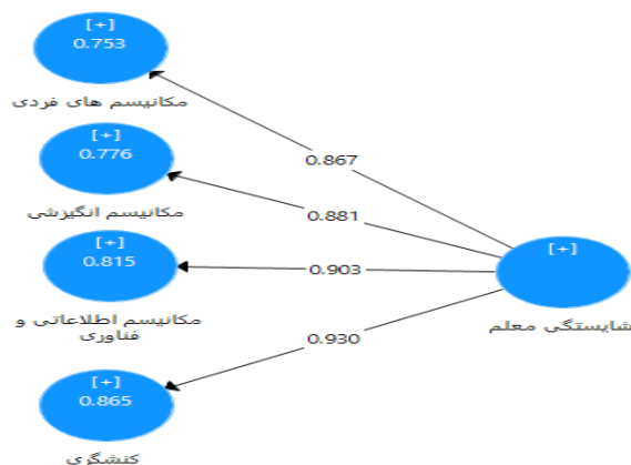
نمودار ۳. تحلیل عامل تائیدی مرتبه دوم مکانیسم‌های شایستگی معلم در نقش یادگیرنده مادام‌العمر Chart 4. Second-order confirmatory factor analysis of teacher competence mechanisms in the role of lifelong learner