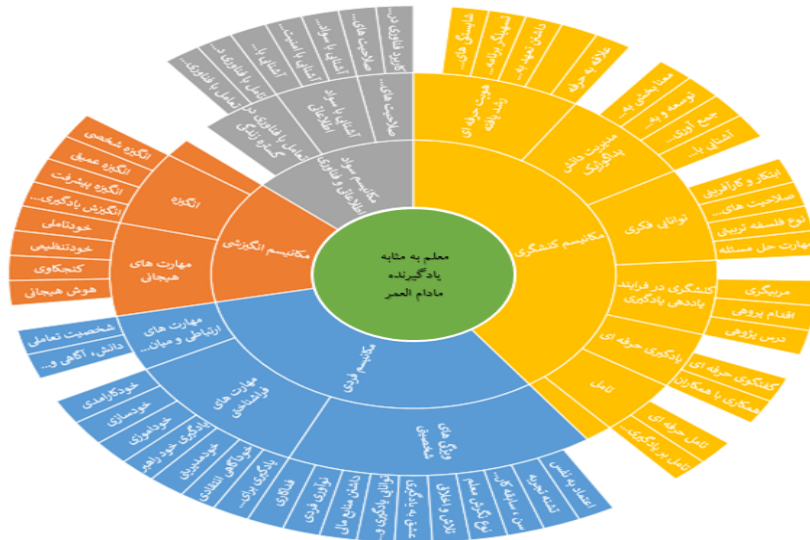
نمودار ۱. نیم‌رخ شایستگی معلم در نقش یادگیرنده مادام‌العمر