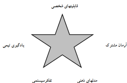
نمودار ۱. اصول سازمان یادگیرنده

نظریه‌پرداز اصلی سازمان یادگیرنده «Peter M. Senge» است؛ Senge سازمان یادگیری را موجودیتی تعریف می‌کند که در آن افراد به‌طور مستمر توانایی‌های خود را گسترش می‌دهند تا به نتایج مطلوب خود دست یابند، جایی که الگوهای جدید تفکر رشد داده می‌شود، فعالیت‌های جمعی آزاد بوده و افراد به‌طور مداوم یاد می‌گیرند که چگونه با یکدیگر یاد بگیرند. از منظر Senge برای سازمان یادگیرنده پنج اصل مطرح است که عبارت‌اند از: