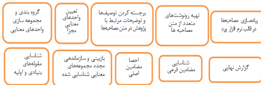
Diagram 1. The overall data collection strategy in this research

شکل ۱. استراتژی کلی گردآوری داده‌ها در این تحقیق