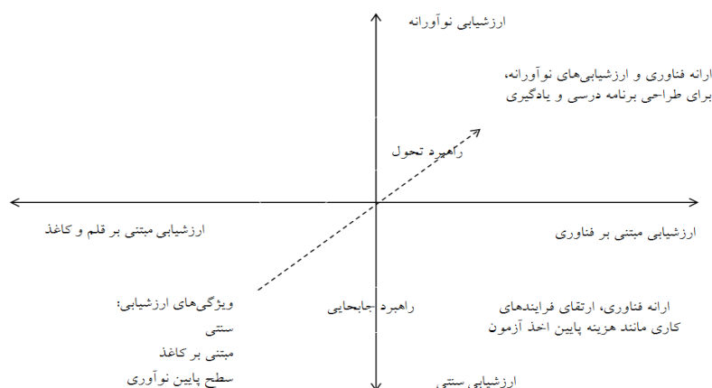
نمودار ۱. ابعاد نوآوری ارزشیابی الکترونیکی

کاغذ به سمت آزمون مبتنی بر صفحه‌ی نمایش باشد. ربع تحتانی راست، نه تنها نشان‌دهنده‌ی جابه‌جایی آزمون‌های کاغذی است، بلکه شامل آزمون‌ها و ارزشیابی‌های توسعه‌یافته مبتنی بر رایانه است که در عین حال بسیاری از مشخصات آزمون‌های سنتی مبتنی بر کاغذ را انعکاس می‌دهد. راهبرد جابه‌جایی، مزایای بسیاری دارد و دلایل قانع‌کننده‌ای برای ارائه‌ی آزمون از طریق صفحه‌ی نمایش وجود دارد. این مزایا عبارتند از: کاهش هزینه‌ها، بهبود گزارشات آزمون و تجزیه و تحلیل عملکرد فراگیران، بالابردن قابلیت اطمینان، بالابردن سرعت علامت‌گذاری و چرخه‌ی گزارش‌دهی. با این حال، ویژگی مربوط به آزمون الکترونیکی در ربع تحتانی راست، این است که هیچ ابتکار مؤثری در برنامه‌ی درسی وجود ندارد. در مقابل، ربع فوقانی سمت راست یک راهبرد تحول با پشتوانه‌ی استفاده از فناوری در ارزشیابی را ارائه می‌کند. ویژگی تعیین‌کننده‌ی ارزشیابی‌های نوآورانه اشاعه‌ی نوآوری در طراحی برنامه‌ی درسی و یادگیری است. برای مثال، یک ارزشیابی مبتنی بر رایانه‌ی حل مسأله (که از فناوری برای نوآوری و یا طراحی ماهیت حل مسأله استفاده شده است) به دنبال ارائه‌ی ارزشیابی مهارت‌هایی است که به‌طور معمول از طریق آزمون‌های کاغذی قابل ارزیابی نیست (همان منبع).